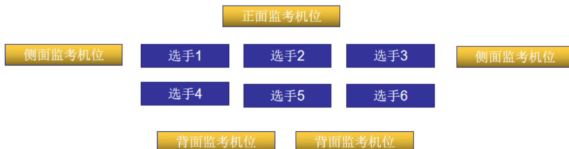
图 2：2 支参赛伍监考机位图